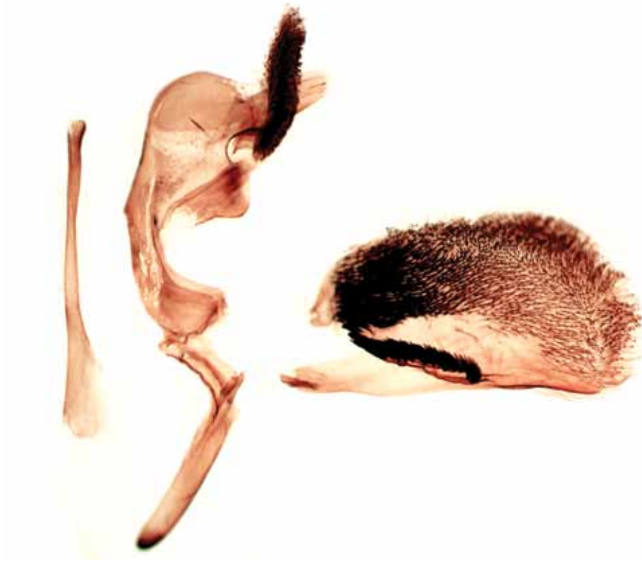
Picture 2 - Synanthedon rubrocingulata sp. n., male genitalia: aedeagus (left), uncus-tegumen (middle), valva (right).

Slika 2 - Synanthedon rubrocingulata sp. n., genitalije mužjaka: aedeagus (levo), uncus-tegumen (sredina), valva (desno).